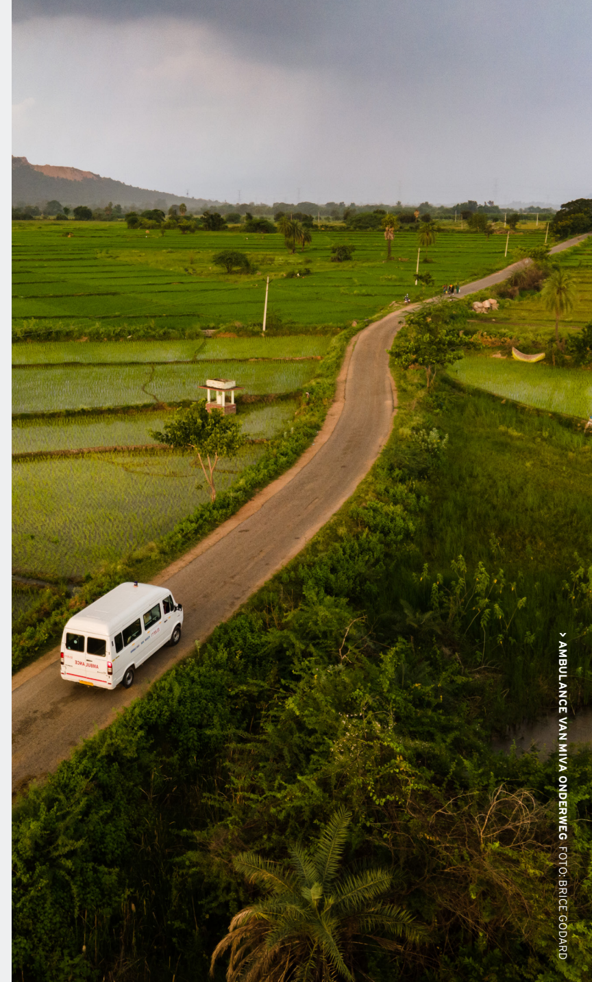
> AMBULANCE VAN MIVA ONDERWEG

MIVA voorziet projecten en hulpverleners namelijk van onmisbare vervoers- en communicatiemiddelen. De toekomstdroom van MIVA? Dat onderwijs en gezondheidszorg bereikbaar zijn voor iedereen.